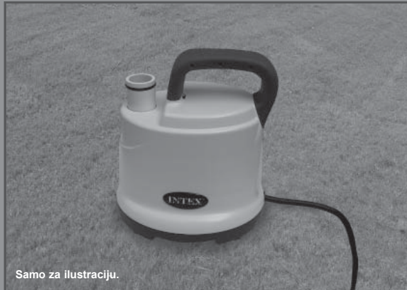
Samo za ilustraciju.

220 - 240 V~, 50 Hz, 99 W, Maksimalna visina 2.5 m, minimalna visina 0.01 m, IPX8